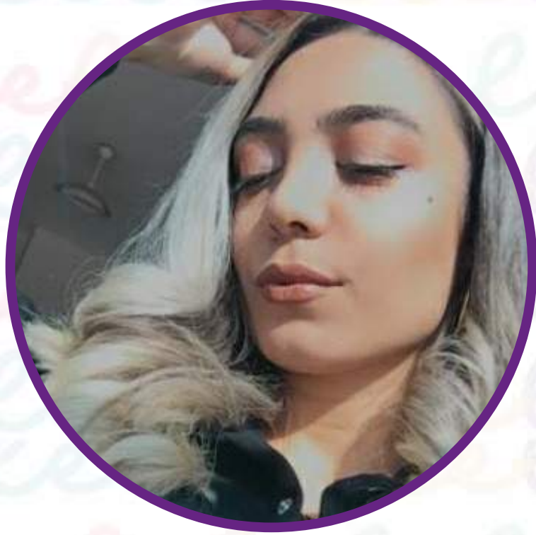
Hatice Gencer "Linol Baskı"